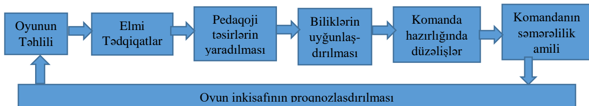
Şəkil 1. Oyunun təkmilləşdirilməsinin texnologiyası

Basketbol oyunun təkmilləşdirilməsi üçün təklif olunan texnologiya zəncirdə göstərilmişdir (şəkil 1).